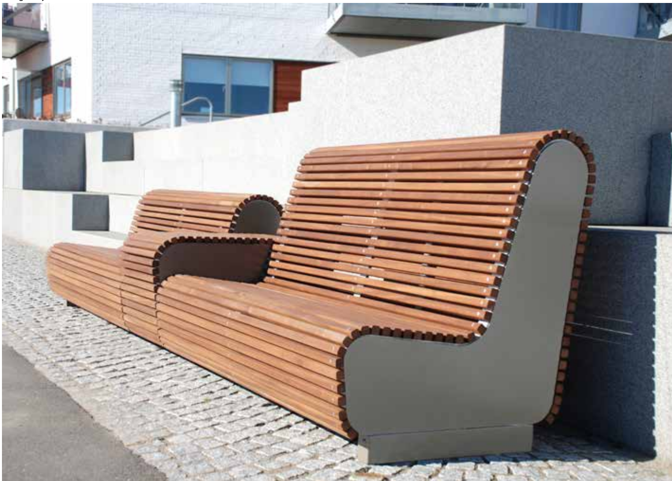
ByMunch Bænk 1, udført i valsede og varmgalvaniserede stålprolier, RAL-lakeret version