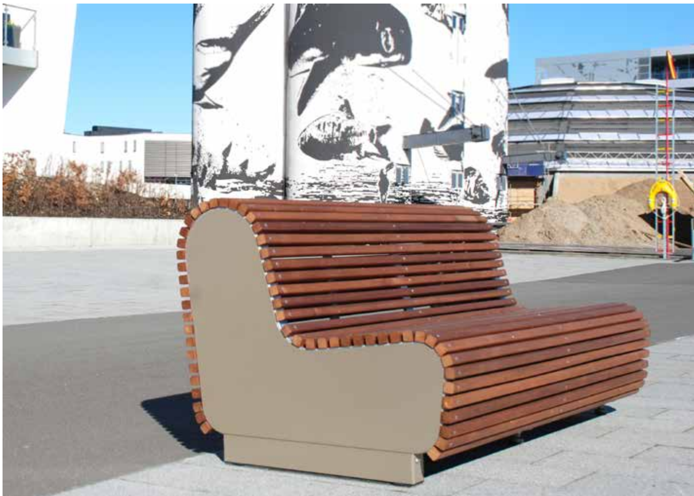
ByMunch Bænk 2, udført i valsede og varmgalvaniserede stålprolier, RAL-lakeret version