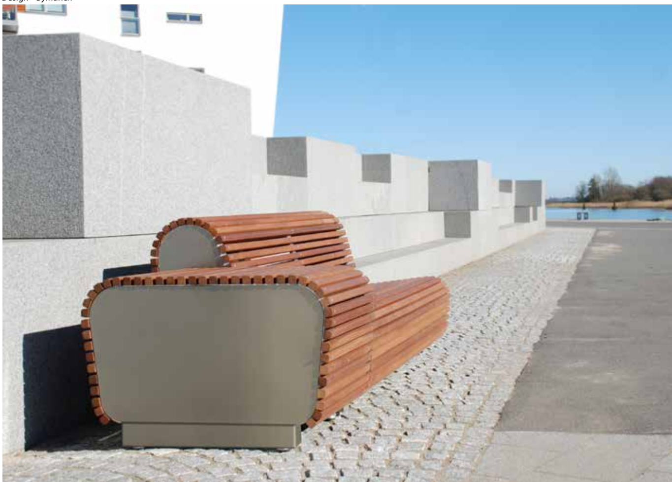
ByMunch Bord, udført i valsede og varmgalvaniserede stålprolier beklædt med lister i mahogni (RAL-lakeret version).